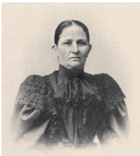
Ю.И. БАЗАНОВА (1852 – 1924), ПОЧЕТНАЯ ГРАЖДАНКА ИРКУТСКА