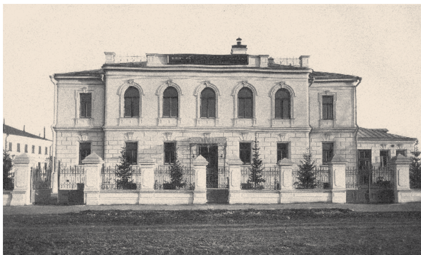
КЛИНИКА УШНЫХ, НОСОВЫХ И ГОРЛОВЫХ БОЛЕЗНЕЙ. МОСКВА, 1896

При этом Клиника была совершенно автономной: собственная электростанция, кухня и пр., а помимо амбулаторных помещений и лабораторий в ней имелся музей препаратов и муляжей ЛОР-органов, анатомические и топографоанатомические муляжи, необходимые для обучения студентов и врачей 8 .