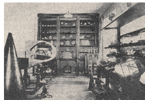
ВНУТРЕННИЕ ПОМЕЩЕНИЯ КЛИНИКИ: ОПЕРАЦИОННЫЙ ЗАЛ, АКУСТИЧЕСКИЙ КАБИНЕТ, АНАТОМИЧЕСКИЙ КАБИНЕТ